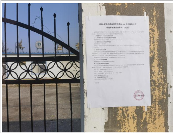
沧州市渤海新区黄骅市羊二庄镇杨庄村动物防疫监督站