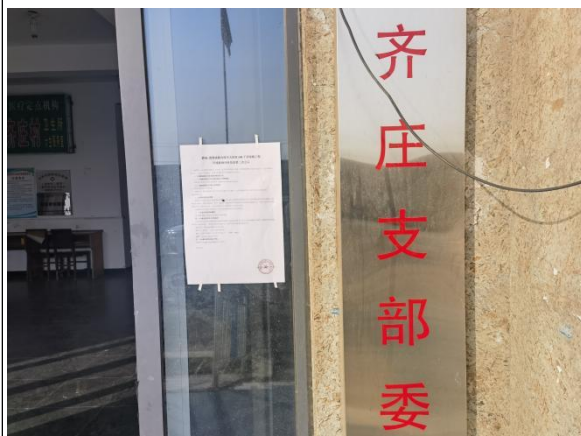
沧州市渤海新区黄骅市羊二庄镇齐庄村