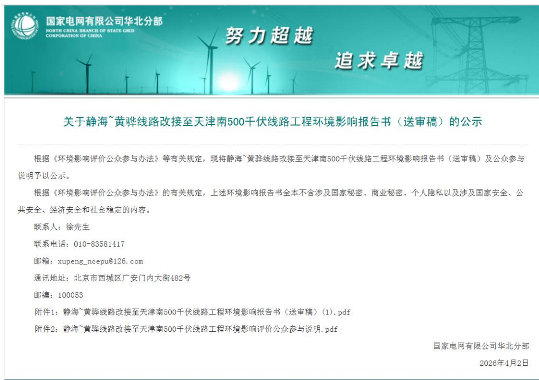
图 6-1 环境影响报告书送审稿公示（国家电网有限公司华北分部网站 2026 年 4 月 2 日）