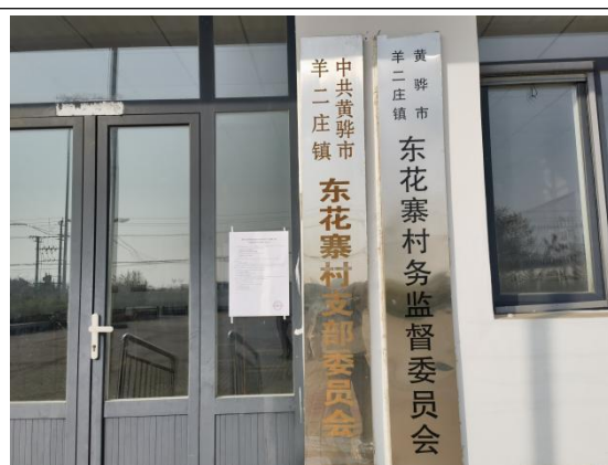
沧州市渤海新区黄骅市羊二庄镇东花寨村