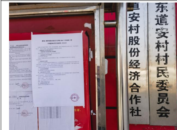
沧州市渤海新区黄骅市滕庄子镇东道安村