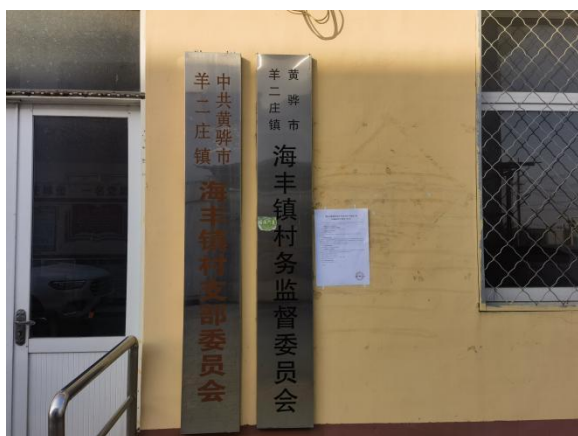
沧州市渤海新区黄骅市羊二庄镇海丰镇村