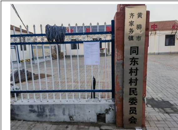
沧州市渤海新区黄骅市齐家务镇同东村