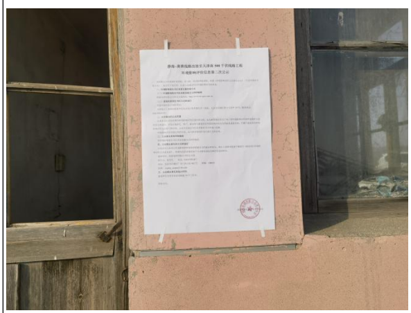
沧州市渤海新区黄骅市长芦盐场