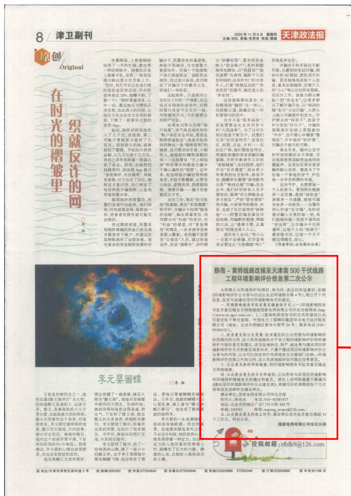
图 3-2 《天津政法报》第一次报纸公示（2025 年 11 月 6 日）