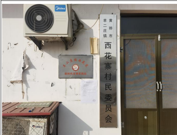
沧州市渤海新区黄骅市羊二庄镇西花寨村