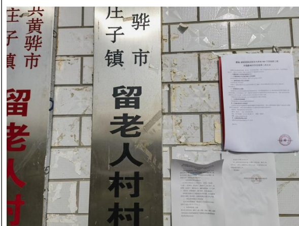
沧州市渤海新区黄骅市滕庄子镇留老人村