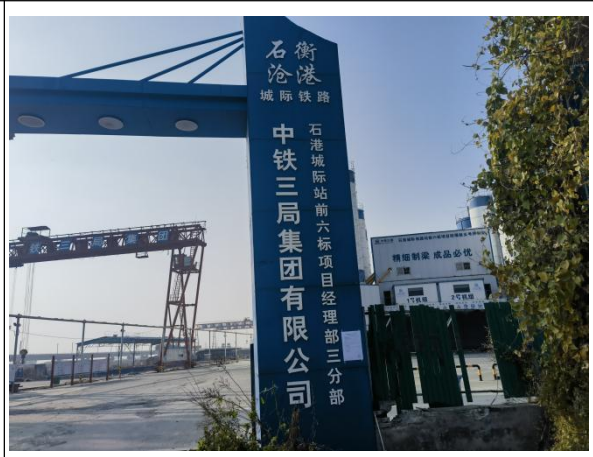
沧州市渤海新区黄骅市羊二庄镇杨庄村石衡沧港铁路项目部