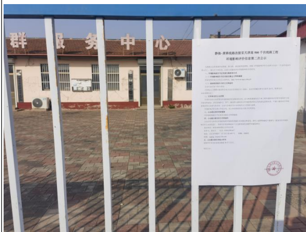
沧州市渤海新区黄骅市羊二庄镇中花寨村