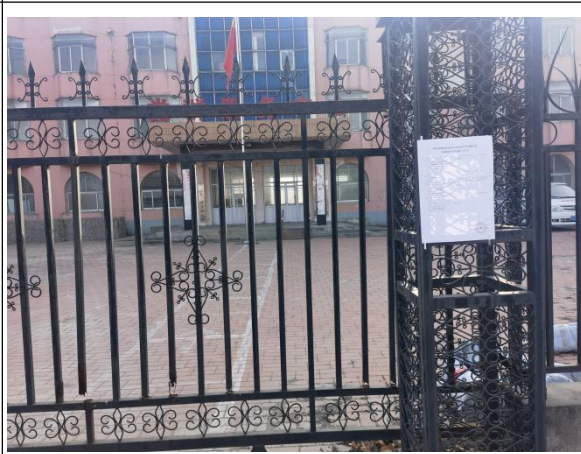
沧州市渤海新区黄骅市羊二庄镇杨庄村