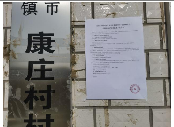
沧州市渤海新区黄骅市滕庄子镇康庄村