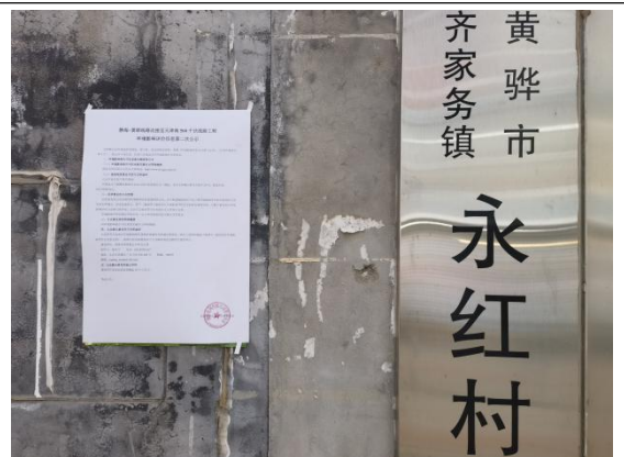
沧州市渤海新区黄骅市齐家务镇永红村