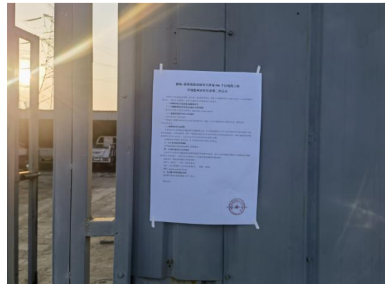
沧州市渤海新区黄骅市新村回族乡虾塘看护房