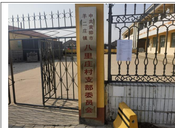
沧州市渤海新区黄骅市羊二庄镇八里庄村